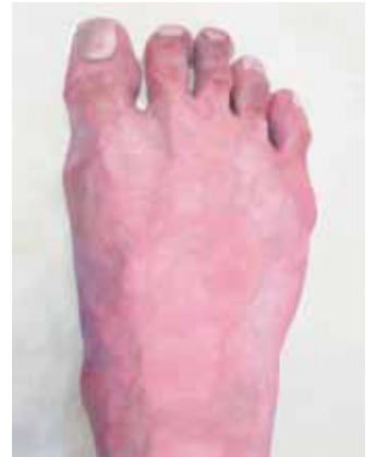
優秀賞 越智 俊介 足